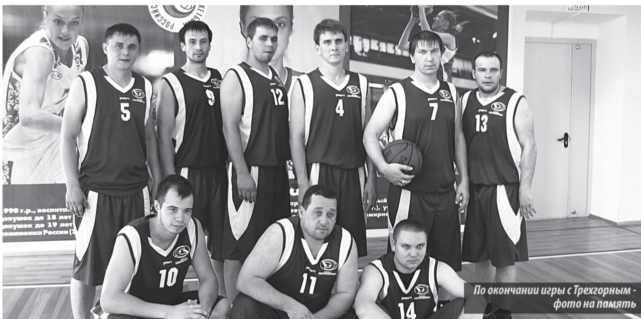
По окончании игры с Трехгорным - фото на память

Х турнир предприятий «Росатом» на приз ФГУП РФЯЦ-ВНИИТФ имени академика Е.И. Забабахина. Мужчины. Снежинск. ДС стадиона имени Ю.А. Гагарина. 22-24.08.2014