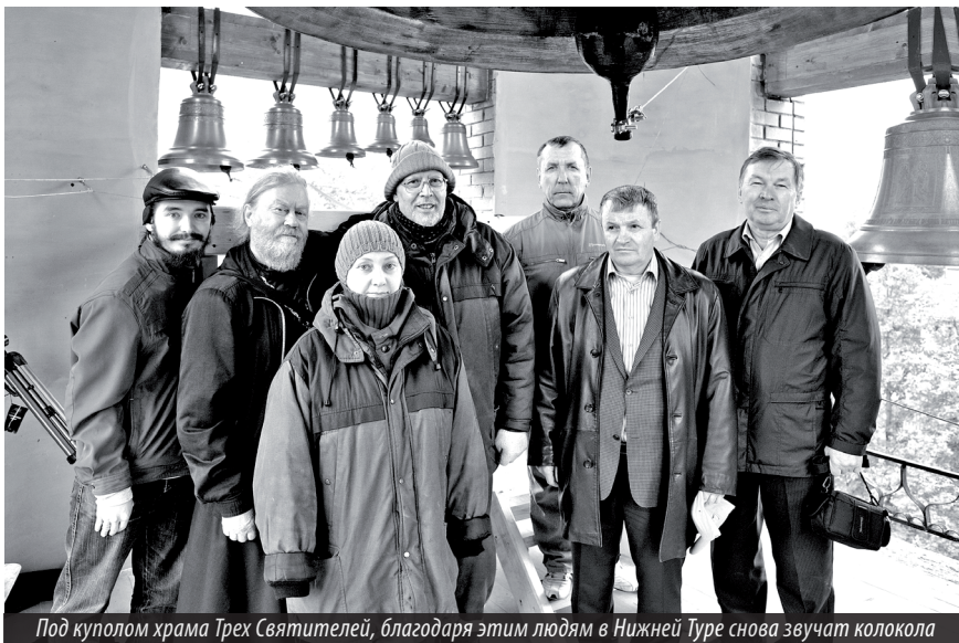
Под куполом храма Трех Святителей, благодаря этим людям в Нижней Туре снова звучат колокола

Наталья КОЛПАКОВА