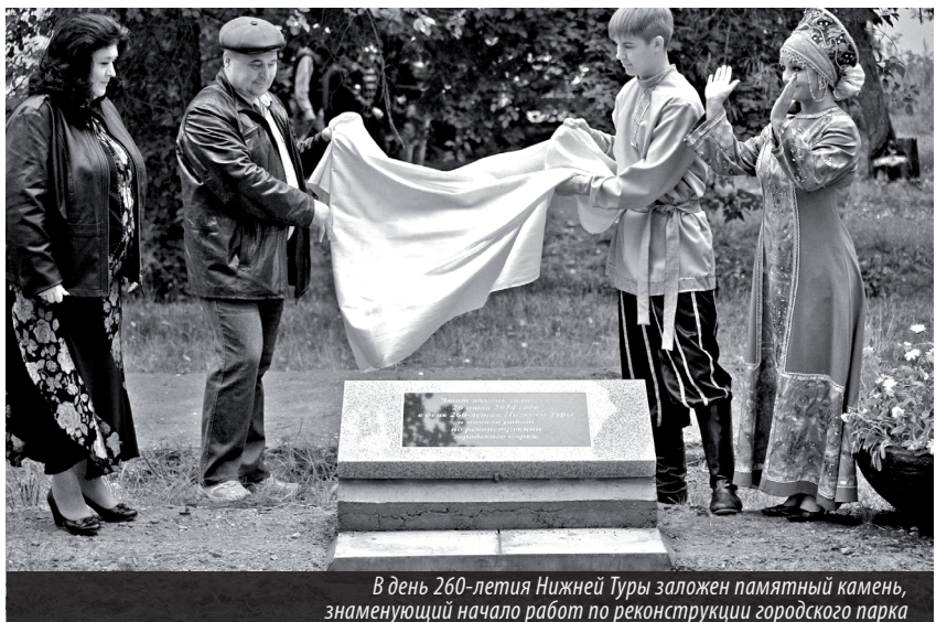
В день 260-летия Нижней Туры заложен памятный камень, знаменующий начало работ по реконструкции городского парка

Мастерством и заботой каждого поколения нижнетуринцев создавался фундамент будущего благополучия. И наша сегодняшняя жизнь требует от нас не меньше умения и усилий. Об этом гово-