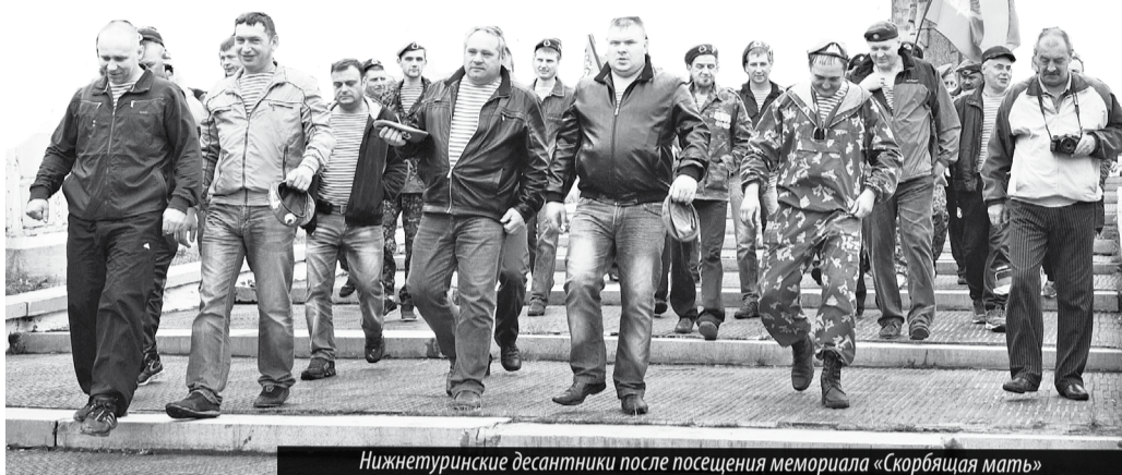
Нижнетуринские десантники после посещения мемориала «Скорбящая мать»