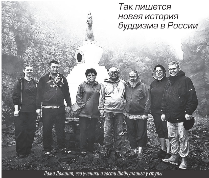
Так пишется новая история буддизма в России