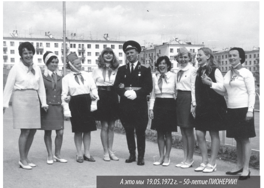
А это мы 19.05.1972 г. — 50-летие ПИОНЕРИИ!