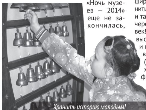
Хранить историю молодым!

«Ночь музеев – 2014» стала уже пятой, и все равно новой, неповторимой. Как они умудряются, эти музейщики, как хватают выдумки, не повториться, каждый раз удивить, восхитить, порадовать?! А потому что любят своих посетителей, уважают каждого, кто перешагнул порог музея, и профессиональная гордость не позволяет повторять уже раз пройденное. И даже больше скажу, «Ночь музеев – 2014» еще не закончилась,