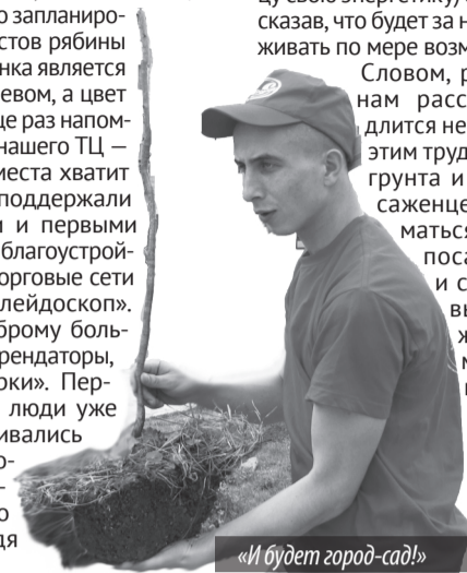
«И будет город-сад!»