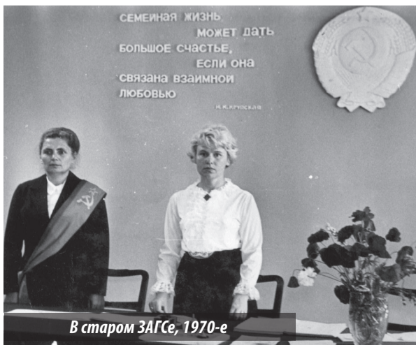
В старом ЗАГСе, 1970-е