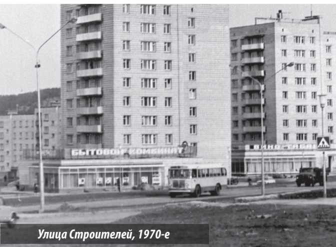
Улица Строителей, 1970-е