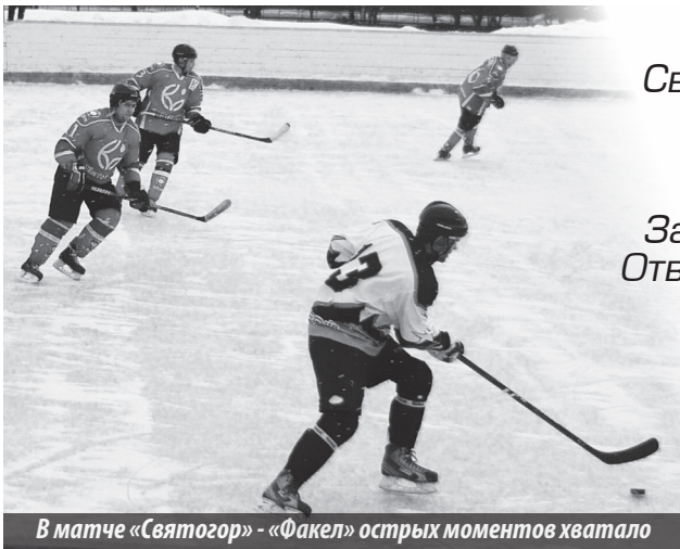
В матче «Святогор» - «Факел» острых моментов хватало

увеличил счет. Но в дальнейшем главный судья матча выписал нам четыре удаления подряд (два из них можно назвать сомнительными), и хозяева сначала в ситуации «пять на три», а затем – «пять на четыре» сравняли результат. В дальнейшем игра шла ободу остро, шансы победить были и у тех, и у других, но превосходно играли вратари.