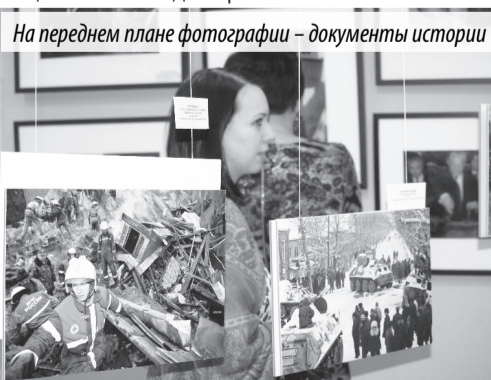
На переднем плане фотографии – документы истории