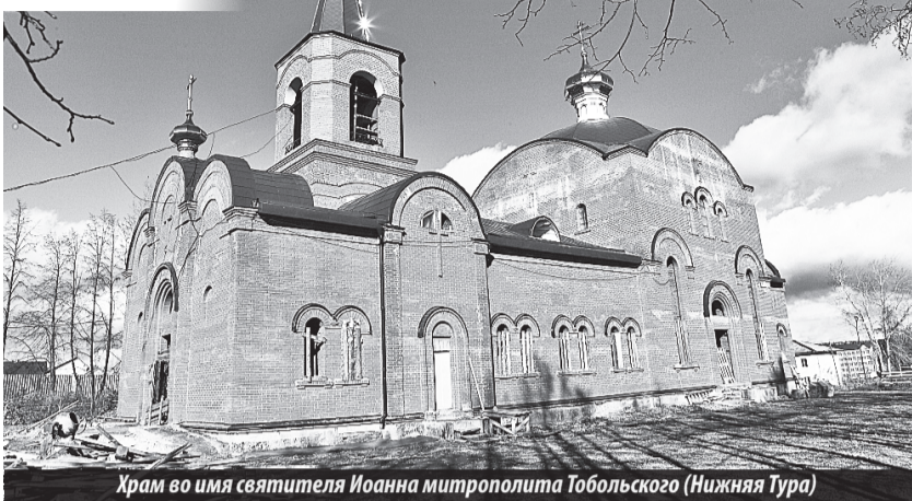
Храм во имя святителя Иоанна митрополита Тобольского (Нижняя Тура)