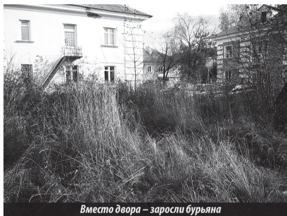
Вместо двора — заросли бурьяна

Именно так называлась майская статья в газете «Трансформация». Вот только заголовок стоял в утвердительной форме. Коснулась она заседания Общественной палаты, главной темой которого стало обсуждение вопросов организации социальной помощи инвалидам на территории городского округа «Город Лесной».