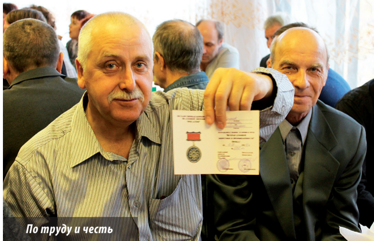
По труду и честь

А вечером того же дня праздник продолжился в кафе «Рябинушка».