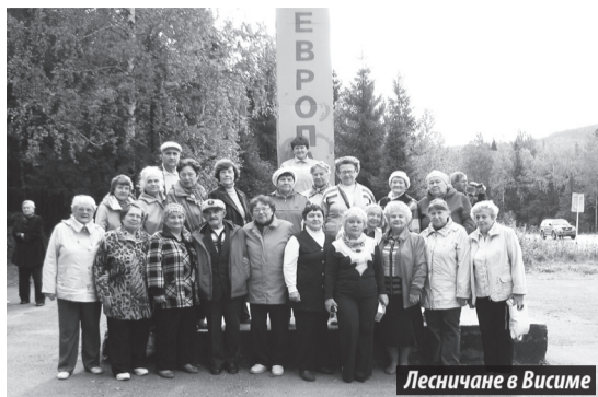
Лесничане в Висиме

Набравшись приятных впечатлений, с хорошим настроением, отдохнувшими душами от вечных забот ехали мы обратно в родной наш Лесной.