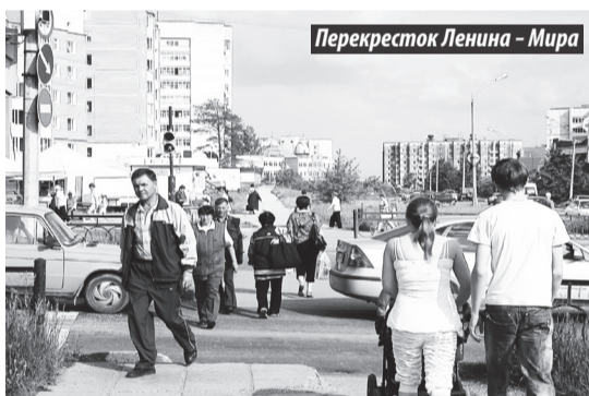
Перекресток Ленина – Мира

Вот и получается: очаги аварийности создают участники дорожного движения, которые частенько пренебрегают ПДД. Им и исправлять положение.