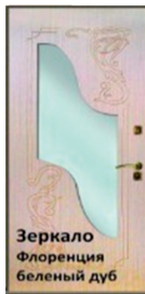
Зеркало Флоренция беленый дуб