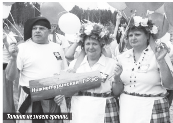
Талант не знает границ.