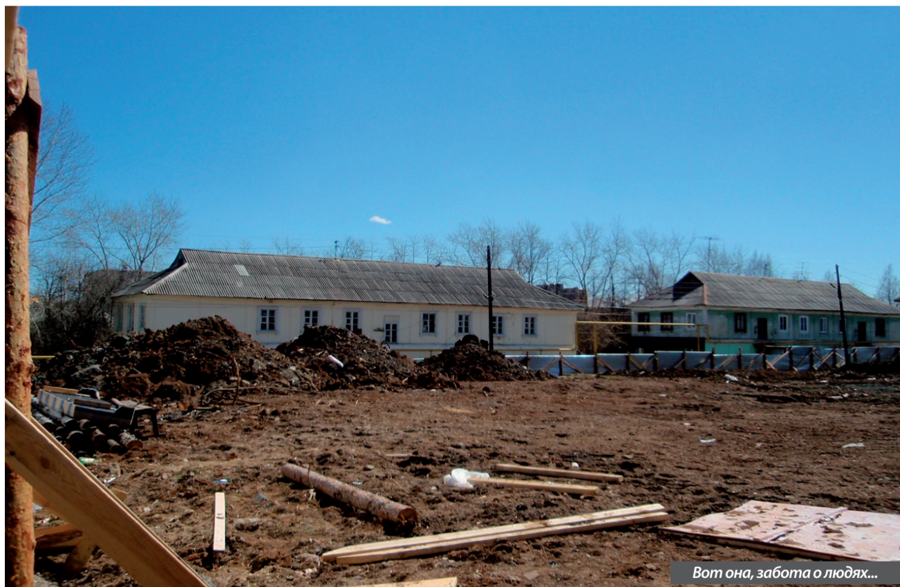
Вот она, забота о людях...