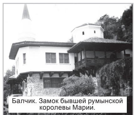
Балчик. Замок бывшей румынской королевы Марии.