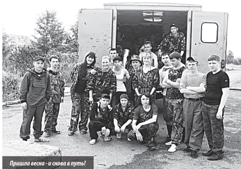
Пришла весна - и снова в путь!

На днях будут отмечать свой профессиональный праздник геологи