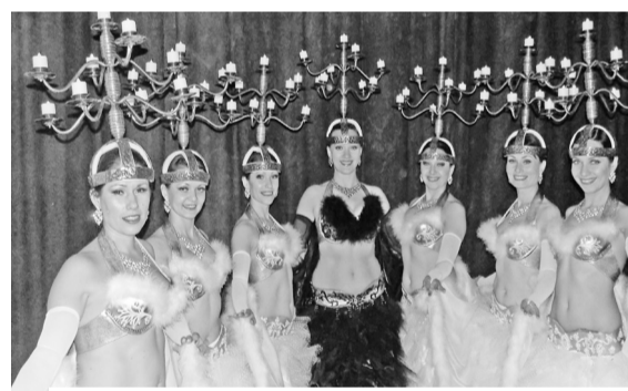
Наши «восточные» красавицы (танец «Лебеди»).

Еще весной участницы клуба восточного танца «Интизар» (Центр культуры «Современник») начали готовиться к конкурсу «Кубок Сибири-2012» по Belly Dance, что был назначен на ноябрь. Он состоялся в Тюмени в ДК «Торфяник».