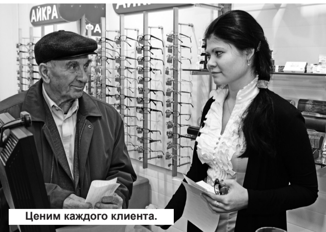
Ценим каждого клиента.

23 октября в Нижней Туре, в торговом центре «Красная Горка» открылся салон брендовой оптики с мировым именем «Айкрафт»