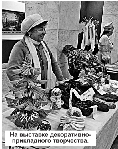
На выставке декоративно-прикладного творчества.

В этом году Нижняя Тура впервые оказалась в числе тех городов и поселков области, где проходит этот ежегодный фестиваль творчества пожилых людей. Для участия в нем к нам в гости приехали артисты из Красноуральска, Качканара, Верхотурья, Лесного. Были среди них и нижнетуринцы. Они исполняли вокальные и танцевальные номера, читали стихи собственного сочинения. Многие удивили публику еще до того, как она достигла зрительного зала. В фойе Дворца культуры работала выставка декоративно-прикладного творчества, где можно