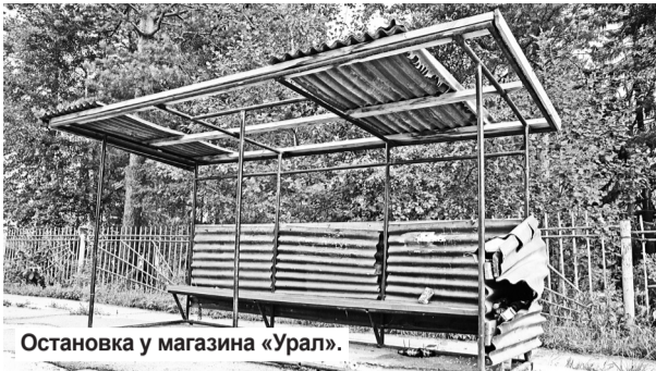
Остановка у магазина «Урал».

Остановки для ответственного транспорта в городе не только не отвечают правилам безопасности, но и правилам эстетики. Сейчас они являют собой остов, точнее скелет исторического прошлого. Ушел в прошлое социализм, ушло с ним и такое явление как поддержка всей архитектуры малых форм, в том числе и остановок в привлекательном состоянии, а сейчас в остановках не скрещивается от дождя, а около магазина «Урал» так не то, что пассажир не в состоянии пройти в мокрую погоду до автобуса, сам автобус не может подъехать к «скелету» остановки. Обшивку унесли металлосты, так как закреплена она была на гвозди, и ветер легко разобрал ее по частям. Остановка «Садовая»: не закреплены боковины, отсутствует часть крыши, стойки погнуты. На «Новой» отсутствует пол. У Машиностроительного завода – скоро обвалится крыша. На Ильича – сгнил весь низ. Ну и у «Урала» сделана была по поговорке – «на тебе, Боже, что нам нежить». А есть ведь ответственные в городе – конечно, не только за то, чтобы не заметить, как город зарос репейем. Но и привести такую малость, как остановки, в красивый архитектурный вид. И город от этого приобретет новое лицо.