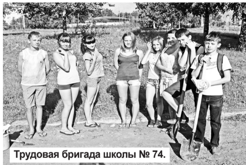
Трудовая бригада школы № 74.