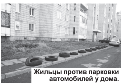
Жильцы против парковки автомобилей у дома.

Уставшие от собственной беспомощности в борьбе с владельцами автомобилей, паркующих свои автомобили вблизи дома, жители «каскадника» недавно устроили им своеобразную «акцию протеста». Суть ее – показать всему городу (и главе округа, в частности), что нижнетуринцы больше не могут мириться с засильем автомобилей в городских дворах.