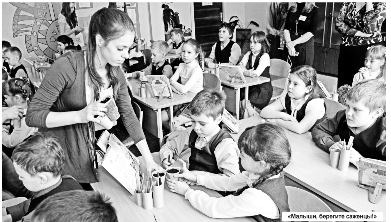
«Малыши, берегите саженцы!»