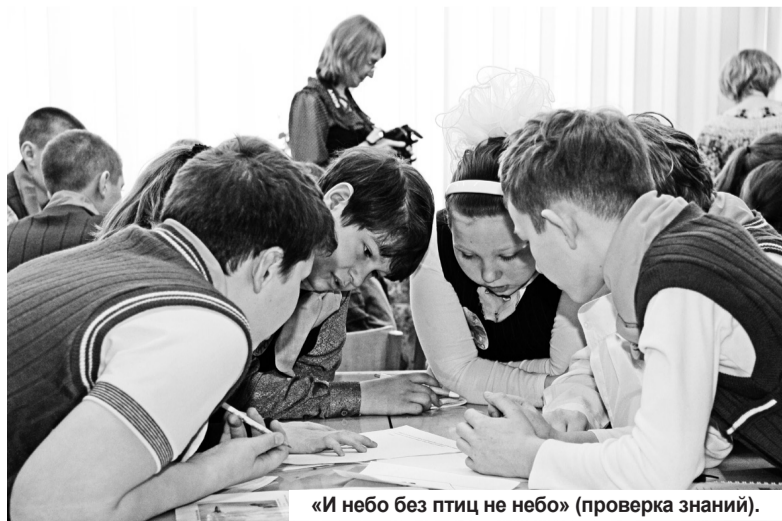
«И небо без птиц не небо» (проверка знаний).

риалы, даже пластиковые бутылки, было бы желание не дать птицам умереть от голода.