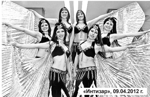
«Интизар», 09.04.2012 г.

Конкуренция была сильная, но профессионализм соперников только подогрел