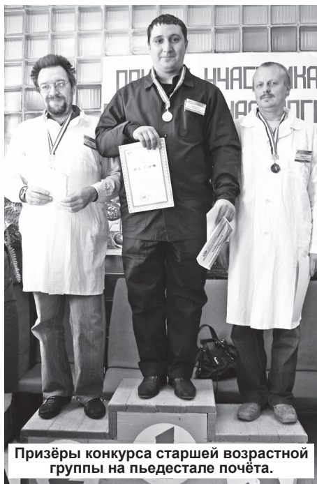
Призеры конкурса старшей возрастной группы на пьедестале почёта.

7 октября в ФГУП «Комбинат «Электрохимприбор» впервые состоялся конкурс профессионального мастерства среди слесарей контрольно-измерительных приборов и автоматики (КИПиА).