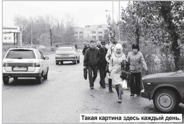
Такая картина здесь каждый день.

К примеру, на дороге от ОАО «Вента» до комплекса «РСЦ» (это у железнодорожного переезда) есть участок тротуара, который уже давно находится в аварийном состоянии, и, как видно, никому до этого дела нет. Работники дорожно-ремонтной службы в течение лета неоднократно ремонтировали проходящую вдоль тротуара шоссейную дорогу, но до тротуара так и