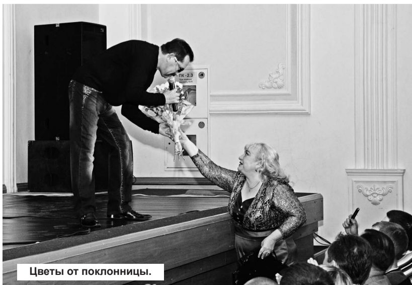
Цветы от поклонницы.