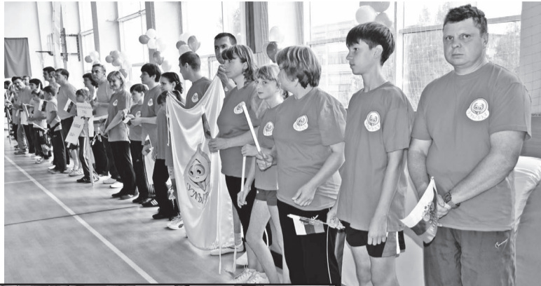
На открытии праздника.

А в это время свободные от состязаний семьи поделились на группы и распределились по разным залам. В