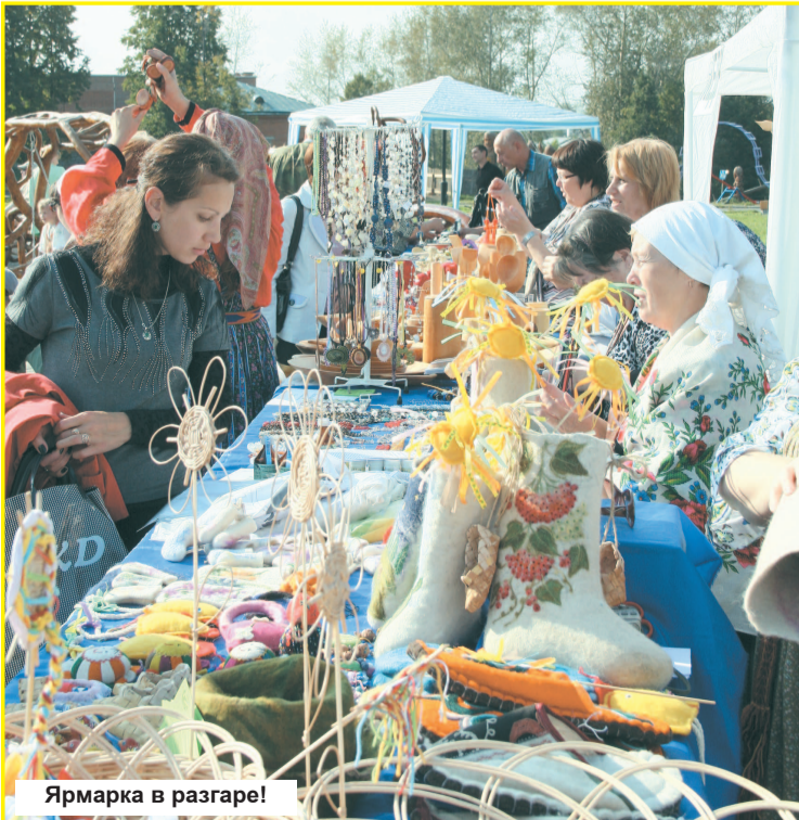
Ярмарка в разгаре!