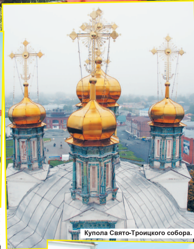
Купола Свято-Троицкого собора.