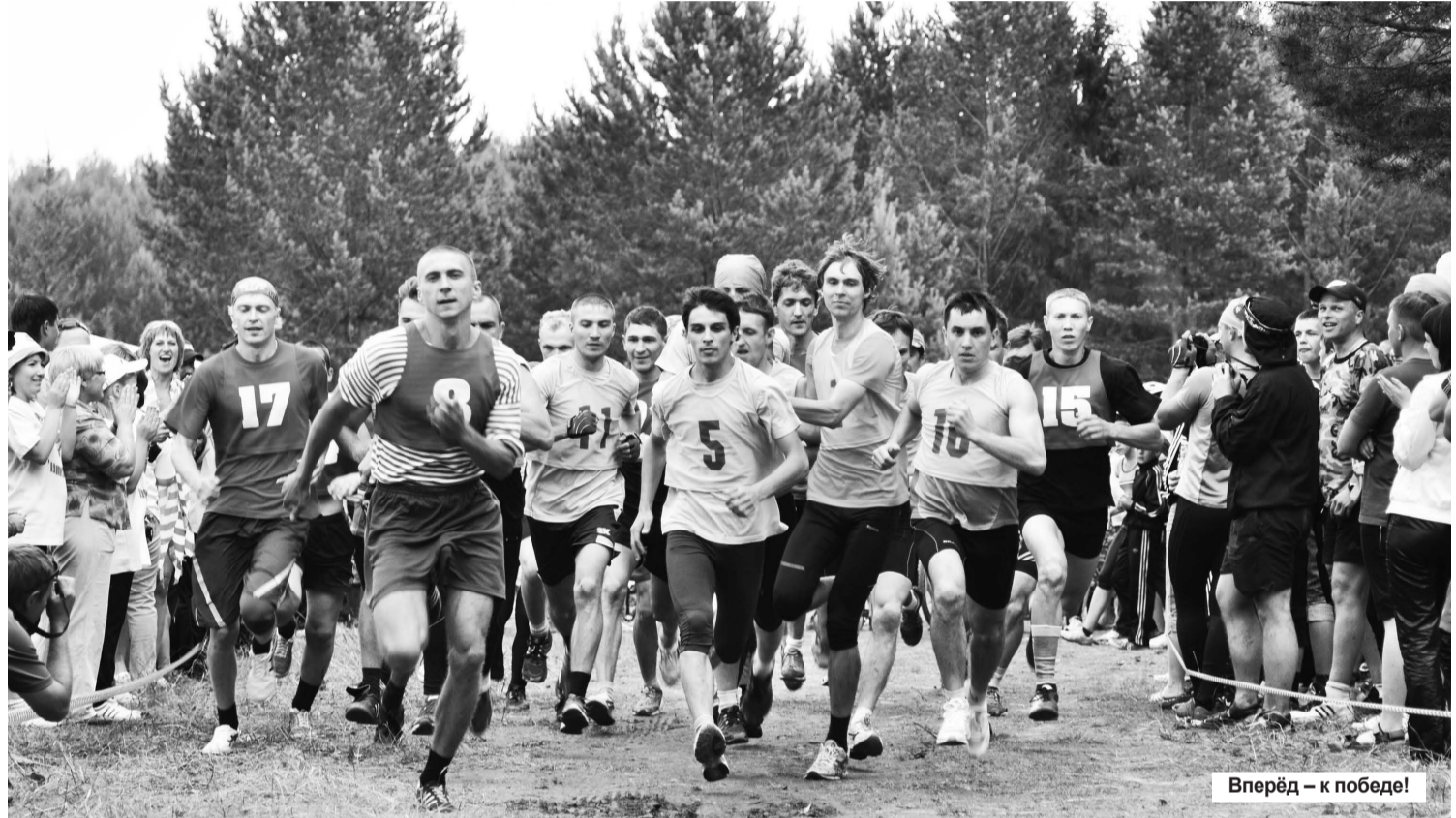
Вперёд – к победе!