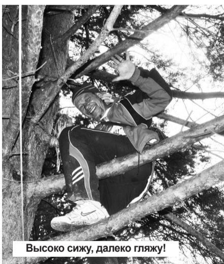
Высоко сижу, далеко гляжу!