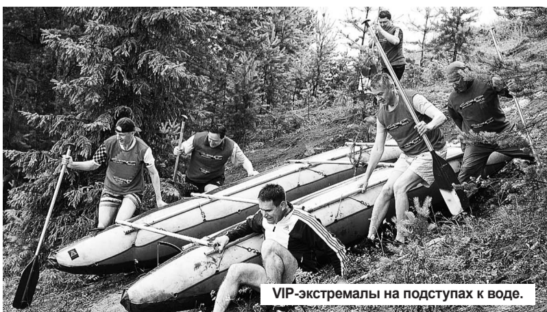
VIP-экстремалы на подступах к воде.