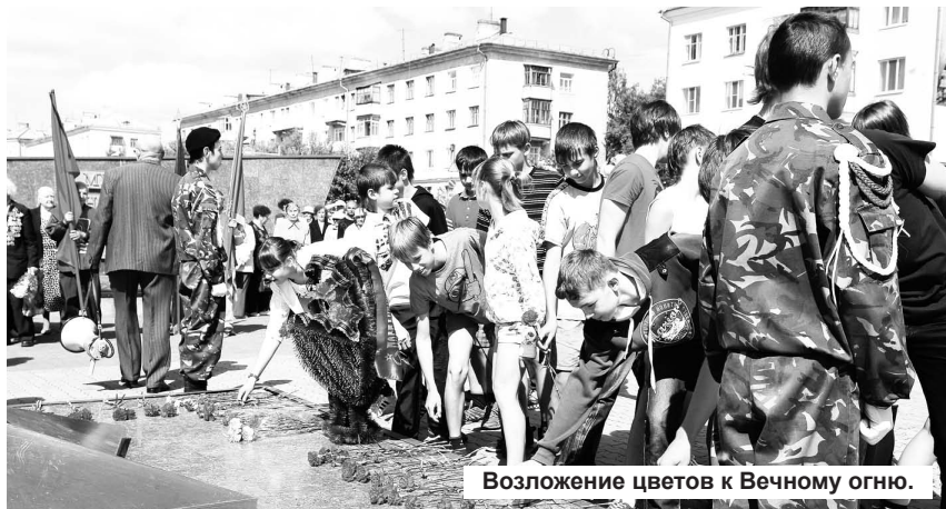
Возложение цветов к Вечному огню.

22 июня в 11.30 в Лесном у обелиска павшим в годы войны, где горит Вечный огонь, встретились ветераны Великой Оте-