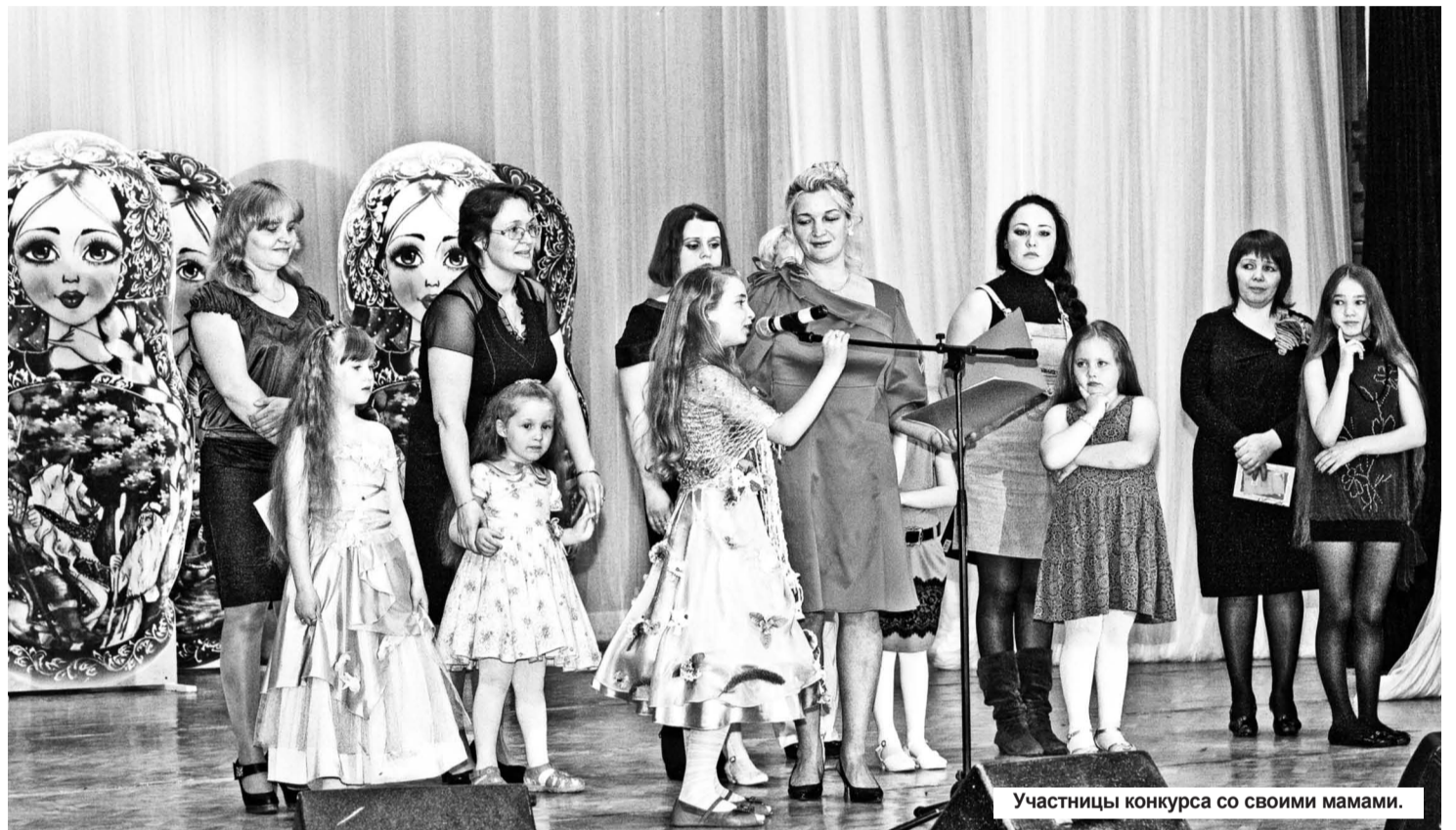
Участницы конкурса со своими мамами.

А пока участницы готовились к конкурсам, зрителей развлекали артисты: хореографический коллектив «Оле Лукойе», вокальный ансамбль «Ассорти», ансамбль современного танца «Антре» и другие. Программа мероприятия была очень насыщенной. Дети, присутствовавшие в зале, настолько были вовлечены в происходящее на сцене, что в такт артистам пели и танцевали. Словом, веселились от души!