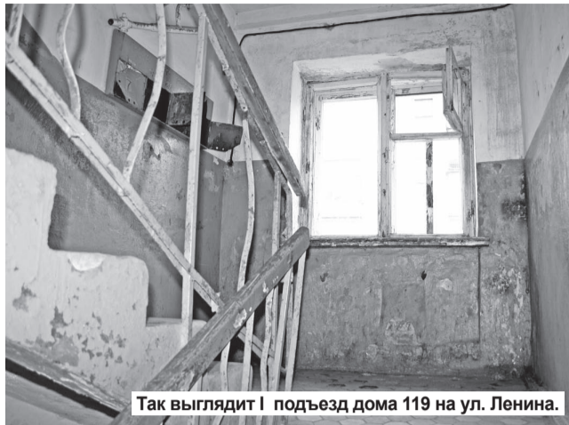
Так выглядит 1 подъезд дома 119 на ул. Ленина.

«Добрый день! Пишут вам жильцы первого подъезда дома № 119 на улице Ленина (г. Нижняя Тура). Мы не раз обращались к руководителям сферы ЖКХ города с жалобой на безобразное состояние нашего подъезда, но там нам ответили, что его капитальный ремонт возможен только согласно очереди, и предлагают ее дожидаться. Но сколько можно ждать? Наш подъезд превратился в приют для бомжей. Двери его постоянно (даже зимой) открыты настежь. В подъезде – грязно, в тамбуре – тень, бомжи и прохожие устроили здесь туалет, почтовые ящики сломаны, квитанции на оплату коммунальных услуг раскладывают на подоконниках (счета валяются по всему подъезду). Чтобы заплатить вовремя за квартиру, мы едем за копиями квитанций на ГРЭС. И это – постоянная проблема. Ну когда же будет порядок в нашем подъезде? Это письмо вы можете расценить как крик души.»