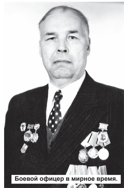
Боевой офицер в мирное время.