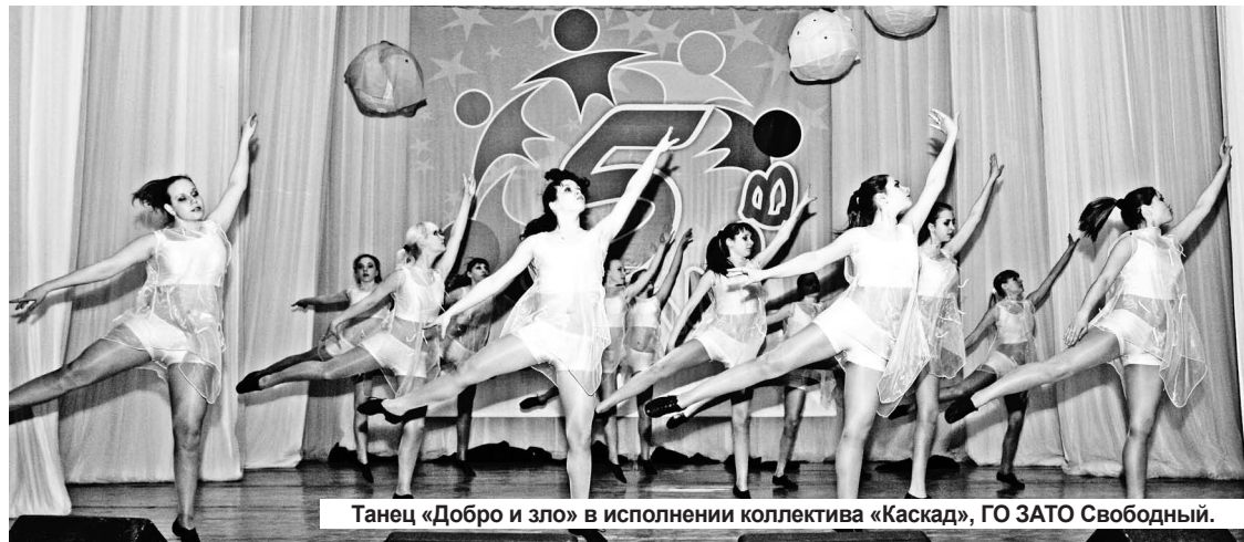
Танец «Добро и зло» в исполнении коллектива «Каскад», ГО ЗАТО Свободный.