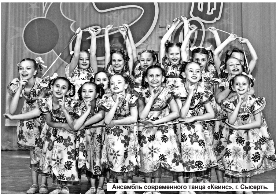
Ансамбль современного танца «Квинс», г. Сысерть.

Наш фестиваль давно шагнул за рамки «открытого городского», но в этом году он был как никогда представительным по географическому охвату городов-участников (г. Сысерть – самый юг области, северные Сосьва и Красноуральск, поселки Шелкун Сысертского ГО и Баранчинский Кушвинского ГО, ГО ЗАТО Свободный, города Качканар, Лесной и Нижняя Тура) и по значимо-