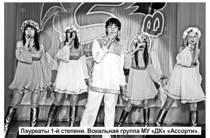
Лауреаты 1-й степени. Вокальная группа МУ «ДК» «Ассорти».