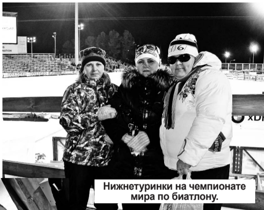
Нижнетурички на чемпионате мира по биатлону.

Но у нас это получилось. Благо чемпионат проходил в Ханты-Мансийске, этот город от нас не так уж и далеко. Эмоции от увиденного переполняют. Такой красоты, такого дру-