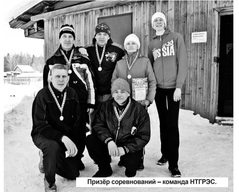
Призёр соревнований – команда НТГРЭС.