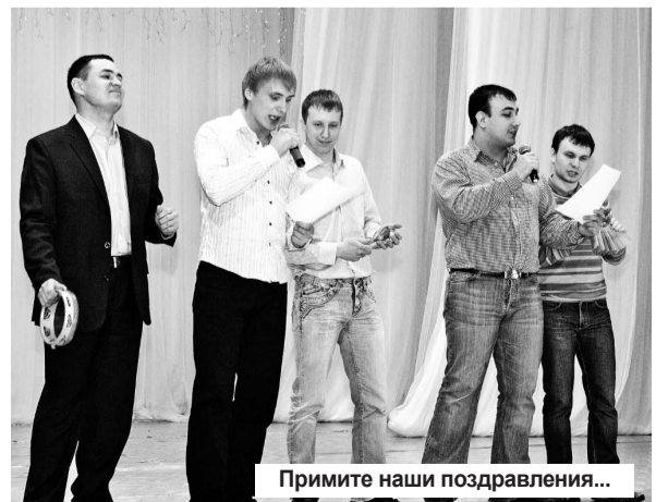
Примите наши поздравления...