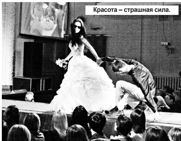
Красота – страшная сила.