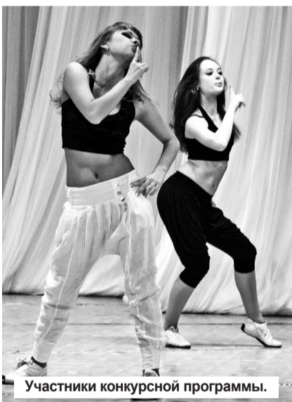
Участники конкурсной программы.

8 марта Нижняя Тура выбирала «Уральскую красавицу – 2011». Главным призом юбилейного конкурса, пятнадцатого по счету, определен десятидневный отдых в пятизвездочном отеле на берегу Средиземного моря. В борьбу за него вступили 7 очаровательных девушек из Нижней Туры.