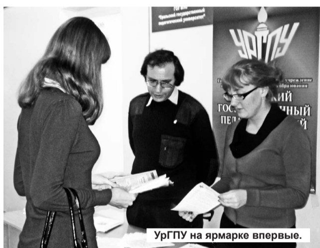
УргПУ на ярмарке впервые.

уже все этажи здания учебного комбината во время ярмарок будут заполнены презентационными стендами. К сожалению, по объективным причинам не смогли участвовать в ярмарке представители ТИ НИЯУ МИФИ, Североуральского политехникума, медучилища и колледжа искусств из Краснотурьинска (краснотурьинцы активно сотрудничали с Лесным в прошлые годы), Уральского института экономики, управления и права; не при-