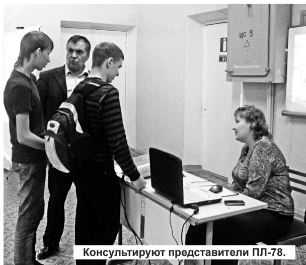
Консультируют представители ПЛ-78.