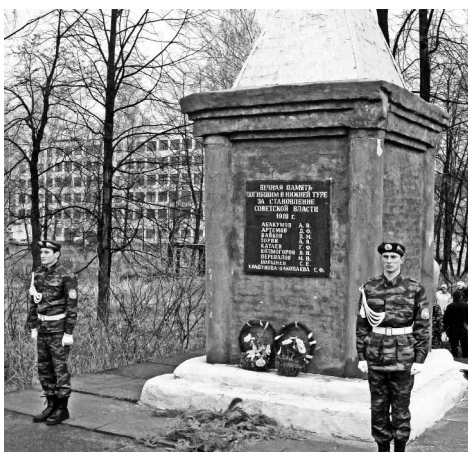
«Вечная память погибшим в Нижней Туре...».