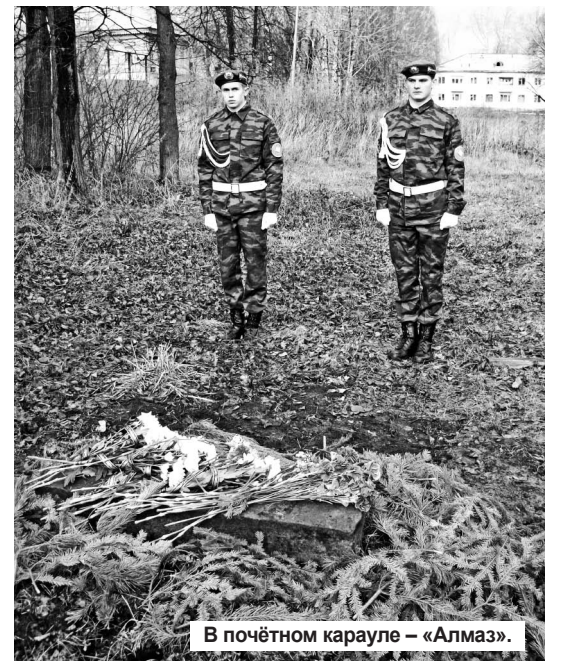
В почётном карауле – «Алмаз».