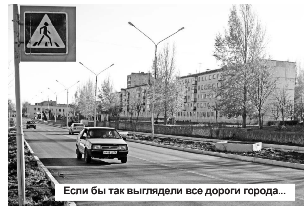
Если бы так выглядели все дороги города...