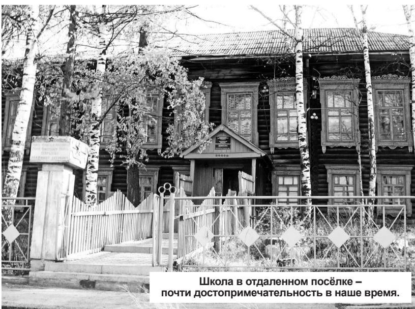
Школа в отдаленном посёлке – почти достопримечательность в наше время.