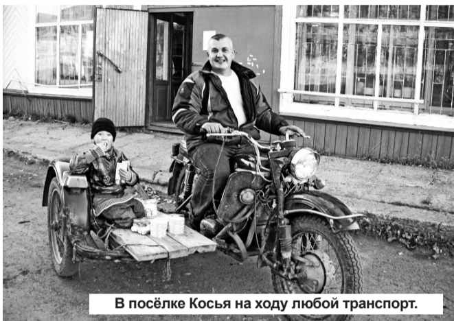
В посёлке Косья на ходу любой транспорт.