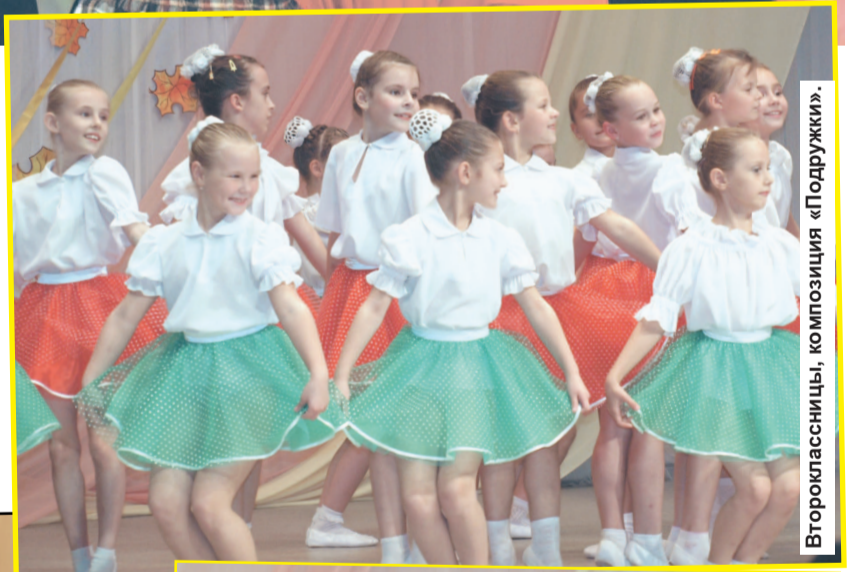
Второклассницы, композиция «Подружки».