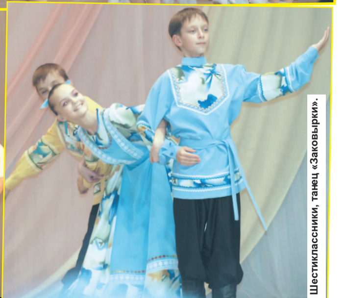
Шестиклассник, танец «Заковырки».