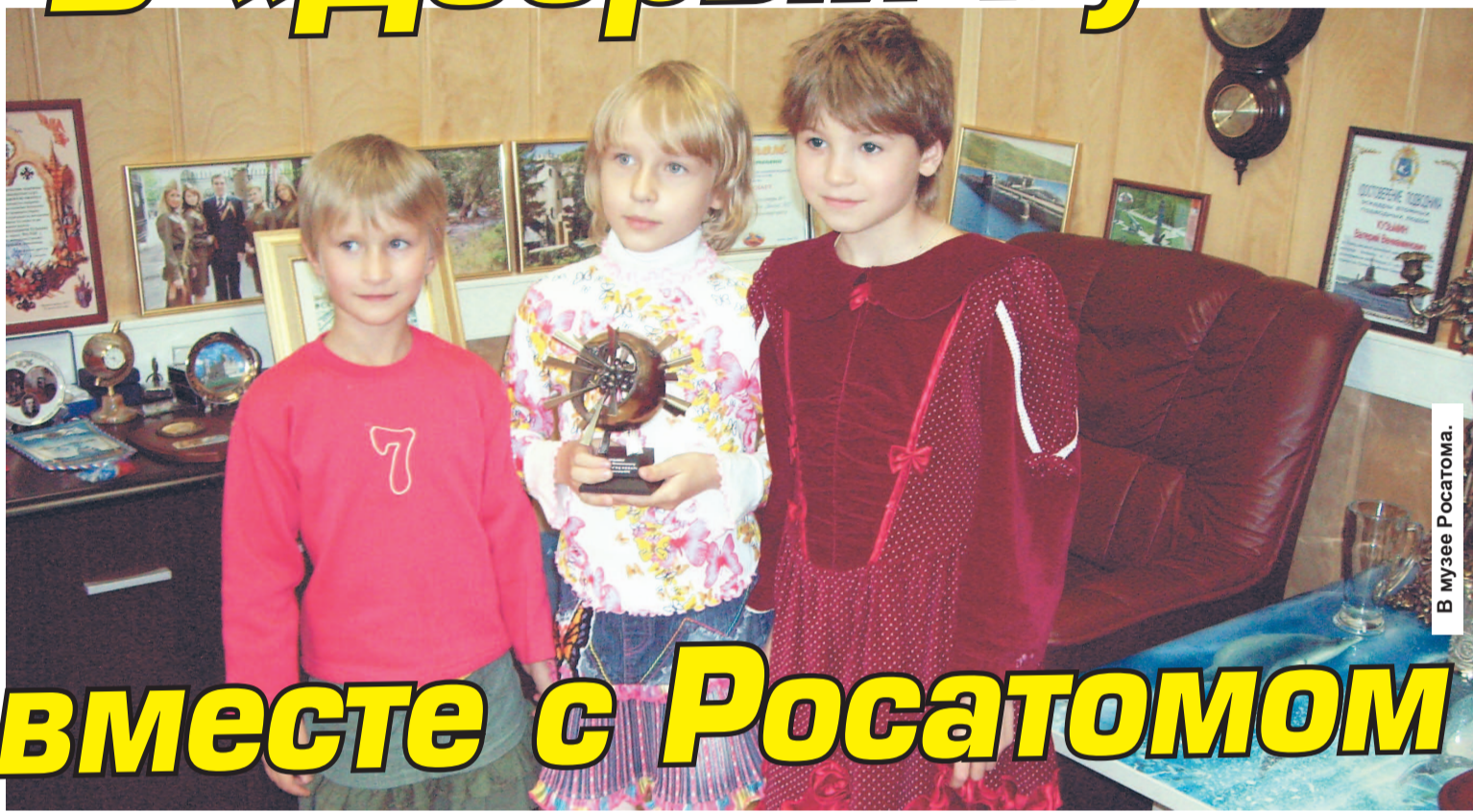
В музее Росатома.