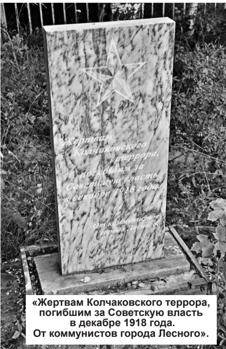
«Жертвам Колчаковского террора, погибшим за Советскую власть в декабре 1918 года. От коммунистов города Лесного».

В начале лета этого года мы со своими ребятами провели разведочные работы в стороне от плиты, поставленной на месте расстрелов, попали на захоронение, поднимать не стали. В июне