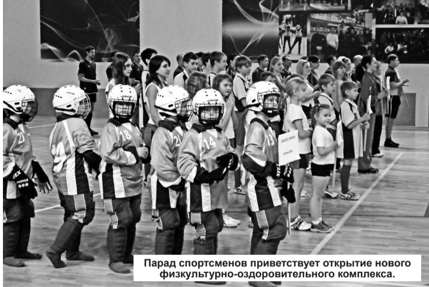
Парад спортсменов приветствует открытие нового физкультурно-оздоровительного комплекса.

Радуется, что соревнования по художественной гимнастике, проводимые в Нижней Туре,