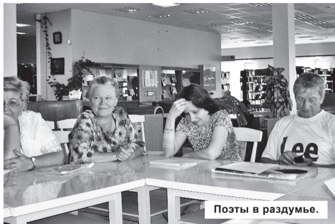
Поэты в раздумье.

Синонимы ли талант и совершенство? Что мы считаем совершенством – только те дары, что нам даны при рождении как чудо, как подарок, или что-то большее? Конечно же, большее. Талант – природное богатство, требующее доработки, огранки, достойной оправы. Это и есть достижение совершенства.