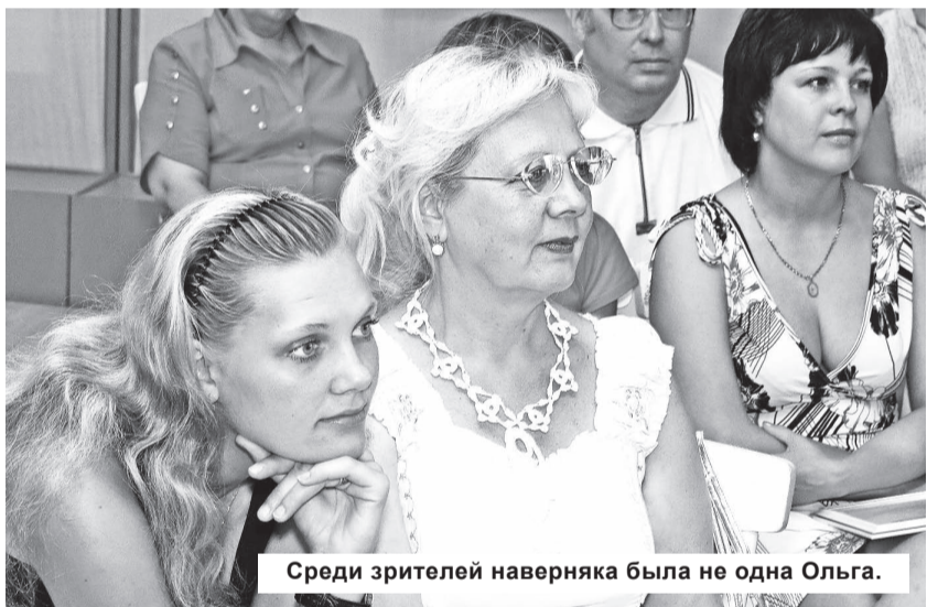
Среди зрителей наверняка была не одна Ольга.