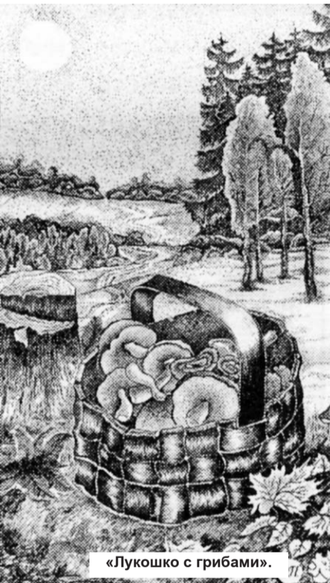
«Лукошко с грибами».