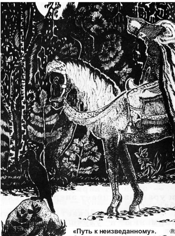
«Путь к неизведанному».