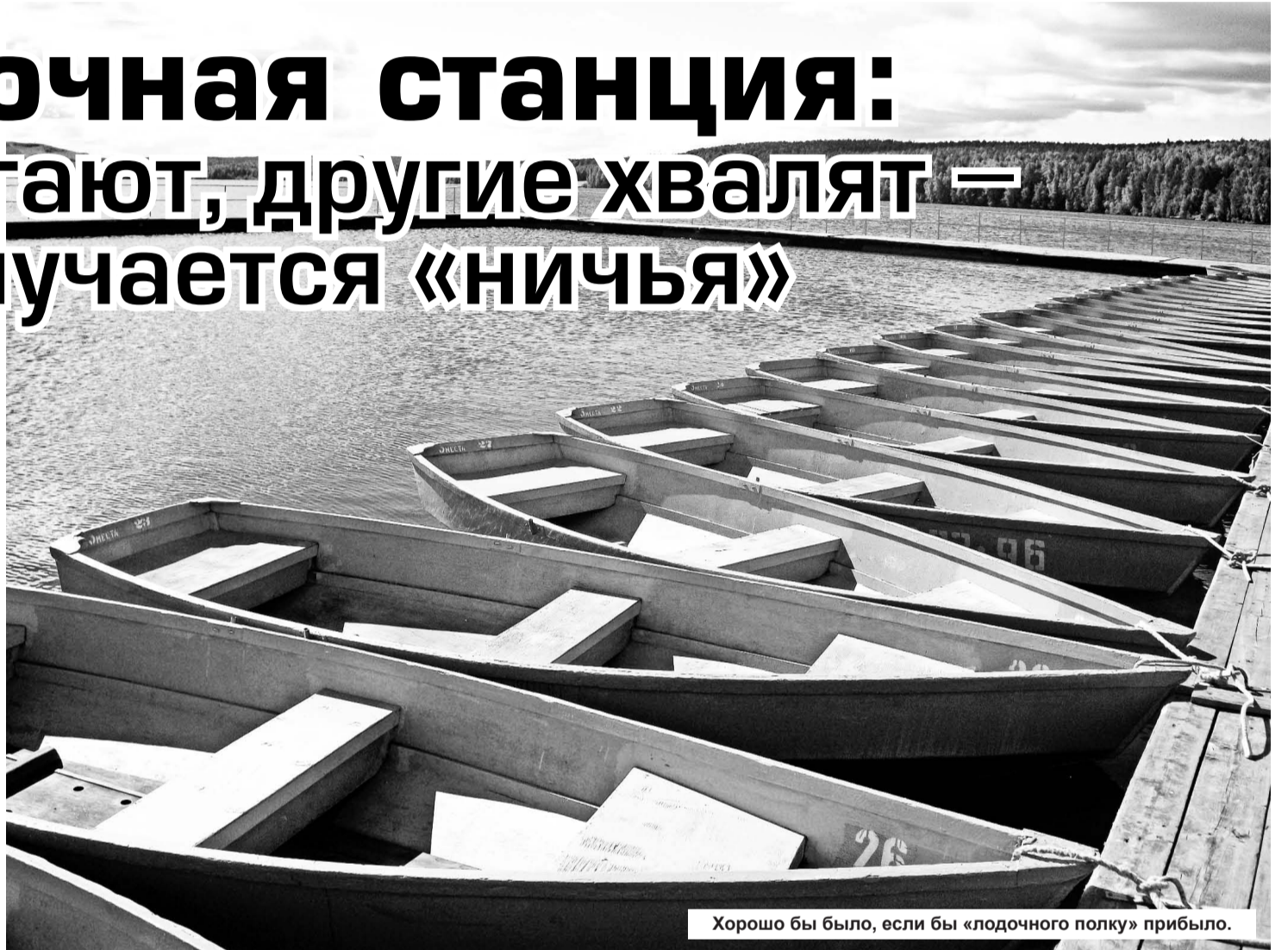
Хорошо бы было, если бы «лодочного полку» прибыло.