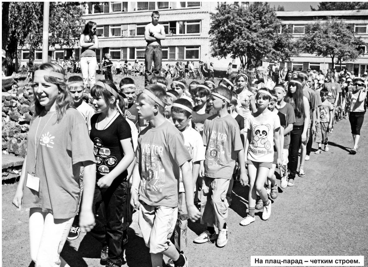
На плац-парад – четким строем.