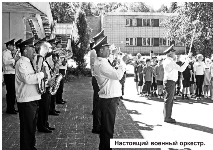
Настоящий военный оркестр.