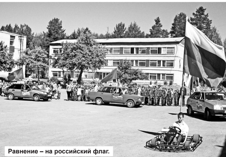
Равнение – на российский флаг.