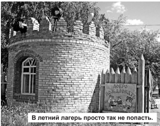
В летний лагерь просто так не попасть.