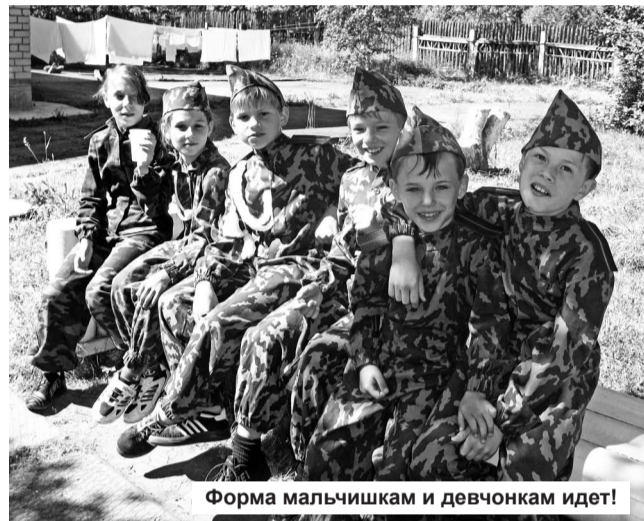
Форма мальчишкам и девчонкам идет!