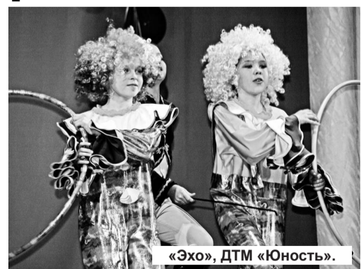
«Эхо», ДТМ «Юность».