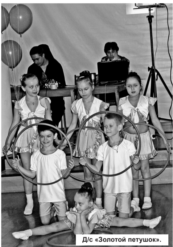
Д/с «Золотой петушок».